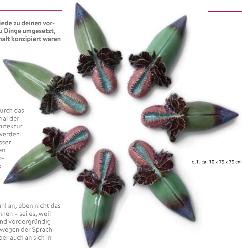
o.T. ca. 10 x 75 x 75 cm

Stärker wird der Einfluss Jingdezhen in den Masken, bei denen ich mit traditionellen Glasuren und Techniken arbeite. Formal anders als die Geister, spielen inhaltlich auch hier das Verbergen des wahren Gesichts und ein Bezug zum Tanz eine Rolle, da Masken in vielen Kulturen eng mit diesem verbunden und auch in China weit verbreitet sind. Themen der vorangegangenen Arbeiten werden weiter getragen, auch wenn sie farblich anders gehalten sind. Durch die hohen Temperaturen von 1360 °C sind die erreichten Glasurfarben weniger kräftig und leuchtend als bei meinen zuvor entstandenen Stücken, die bei 1050 °C glasiert sind. Gebrannt wurden die Stücke im Gemein-