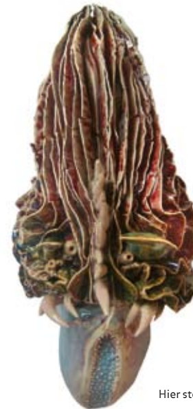
Hier steht eine Bildunterschrift