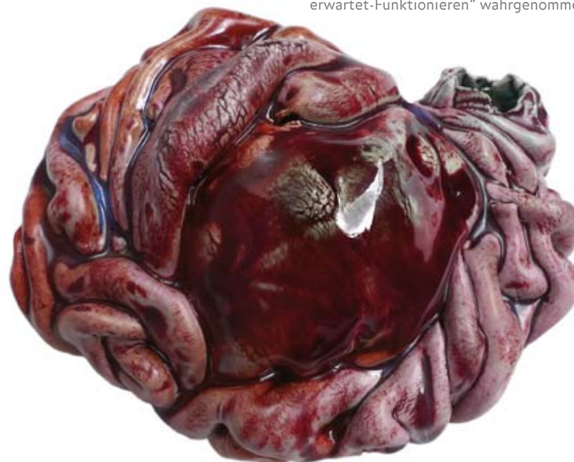
o.T. 28 x 13 x 22 cm

Hier setzen die Keramikerarbeiten an. Für mich sind sie wie Wesen einer alternativen Evolution, die andere Formen hervorbringt und verschiedene Deutungen zulässt. Und sie verweisen auf Natur im weiteren Sinne – ein System, das sich ständig selbst verändert und neue Lebensformen hervorbringt. Mich fasziniert diese Vitalität, die sich mit aller Macht Bahn bricht und dabei Schönes in gleichem Maß wie Abscheu-Erregendes produziert. Schließlich sind es oft die Abweichungen von der Norm, die uns faszinieren, aber auch provozieren und uns eine Auseinandersetzung mit uns selbst im Gegensatz zu diesem erlaubt. Die natürlichen Qualitäten von Ton stimmen insofern mit meinen inhaltlichen Interessen überein, da man Keramik eben nie ganz kontrollieren kann. Meine Arbeiten beziehen sich also nicht direkt auf aktuelle Ereignisse und Entwicklungen, denn mich interessieren vielmehr Aspekte, die fundamental menschlich und daher zeitlos sind – wie unsere Ängste, Triebe, und zwischenmenschlichen Verhaltensweisen, also Momente, die oft als Kontrollverlust, Abweichung oder als ein „Nicht-wie-erwartet-Funktionieren“ wahrgenommen werden.