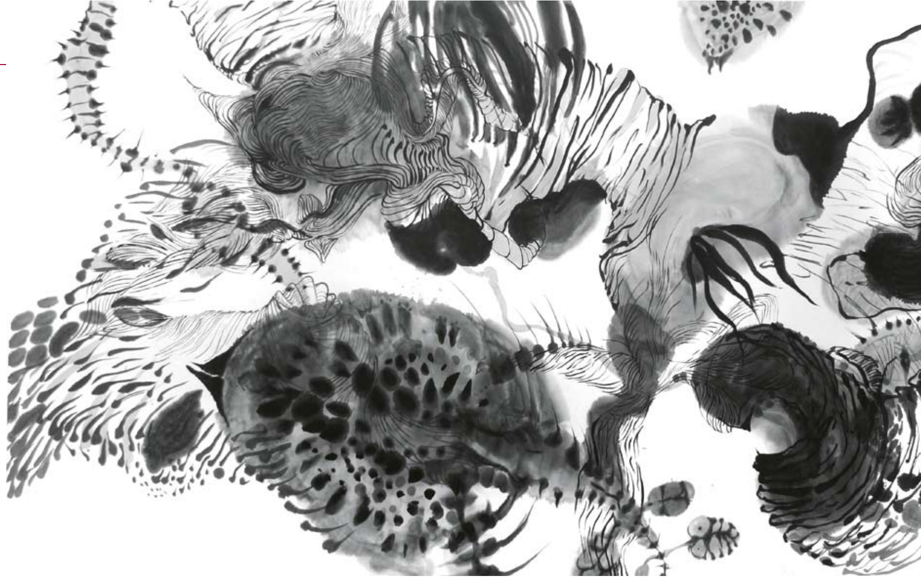
Hier steht eine Bildunterschrift

Obwohl sich einige meiner Arbeiten mit Design auseinandersetzen, bleibt meine Arbeit für mich doch immer Kunst. Design ist für mich in der Regel etwas meist in großer Auflage Hergestelltes, das ich im Alltag benutze, etwas, das mir im normalen Umgang Freude macht, weil es nicht nur hervorragend eine praktische Funktion erfüllt, sondern auch noch formschön ist. Kunst dagegen hat für mich keine praktische Funktion zu erfüllen, sie ist grundsätzlich frei und gibt so Raum für Reflexionen und inhaltliche Auseinandersetzungen. Nun gibt es aber natürlich Grenzgänge, die für mich immer interessant sind, etwa wenn eine Gebrauchskeramik mit bildlichen Motiven bemalt ist, oder wenn ein Design stark konzeptionelle Züge aufweist und sich auf interessante Weise mit dem Alltag auseinandersetzt. In diesem Zusammenhang waren meine Aufenthalte in Holland immer sehr anregend, da dort Design oft konzeptioneller verstanden wird und die Grenzen weniger wichtig sind. Ein grundsätzliches Interesse gerade an diesen Grenzgängen geht auch auf meine Studienzeit an der Bauhaus-Universität zurück, in der Künstler und Designer nebeneinander in den Werkstätten standen und oft auch die gleichen Projekte belegten.