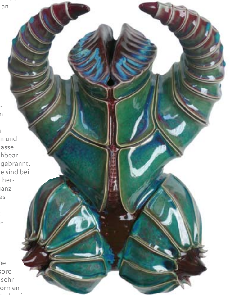
BB4, 47 x 66 x 31 cm, Porzellan, 2009